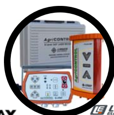
LE LASER ELECTRONICS