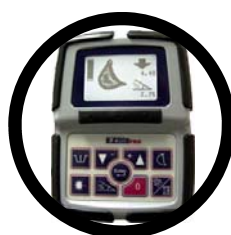
EZ DIG PRO